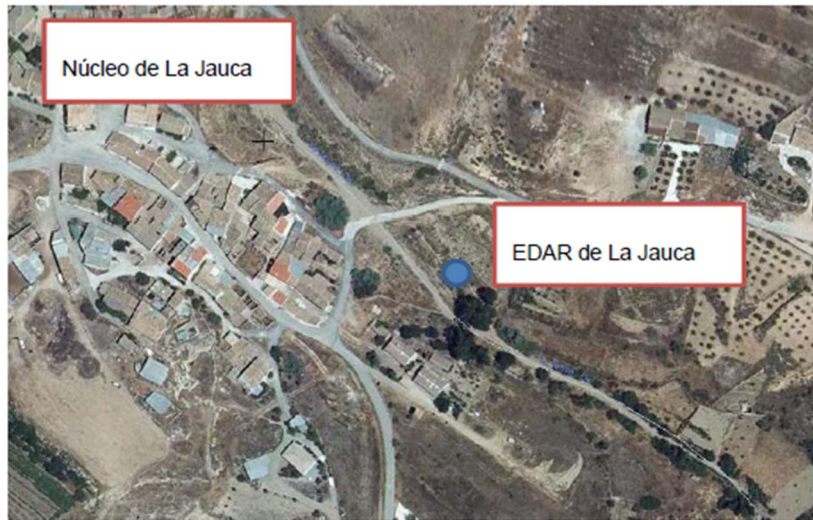
Ilustración 3: EDAR la Jauca. Localización