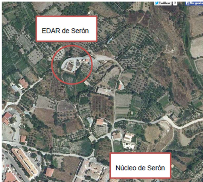
Ilustración 2: EDAR de Serón. Localización