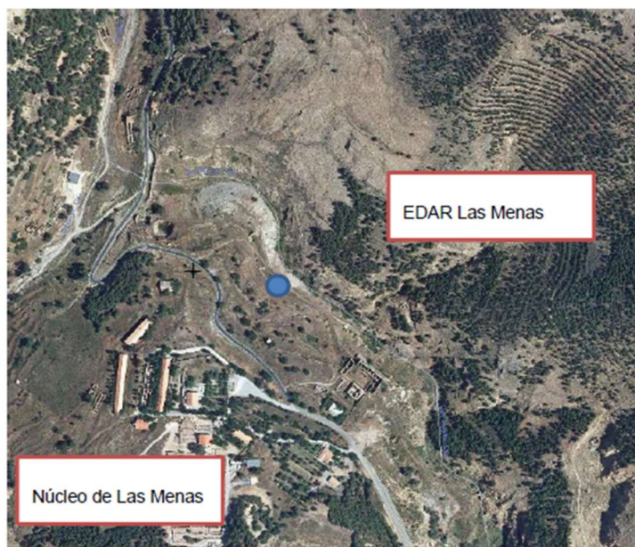
Ilustración 4: EDAR Las Menas. Localización

Las principales características de los sistemas de tratamiento de aguas residuales del Término Municipal de Serón se recogen en la siguiente tabla.